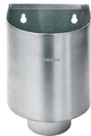
RHEINZINK vergaarbak Mini 80 mm