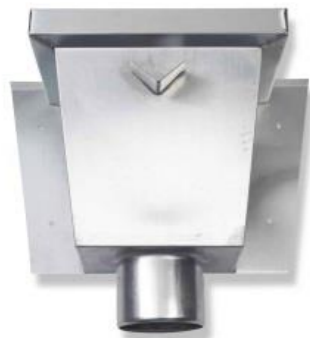
RHEINZINK vergaarbak Vierkant 80 mm