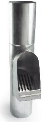
RHEINZINK bladafscheider 80 mm met RVS-bladvanger