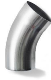
RHEINZINK bocht 80 mm 40 graden