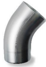
RHEINZINK bocht 80 mm 40 graden verjongd spie-eind