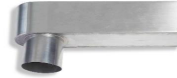
RHEINZINK stadsuitloop 80 mm; 80x100 mm