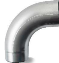
RHEINZINK bocht 80mm 85 graden verjongd spie-eind