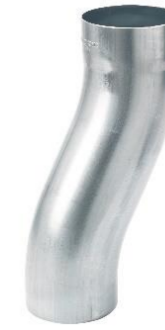
RHEINZINK sprongstuk 80 mm; sprong 60 mm