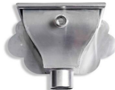
RHEINZINK vergaarbak Oud-Hollands 80 mm