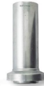
RHEINZINK montage- schuifstuk 80 mm