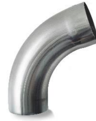
RHEINZINK bocht 80 mm 72 graden