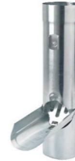
RHEINZINK regentonklep 80 mm