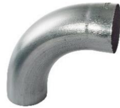
RHEINZINK bocht 80mm 85 graden