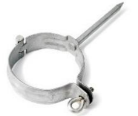
Scharnierpijpeugel met slagen voor stalen ondereind 80 mm