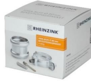
RHEINZINK HWA-buis bevestigingspakket 80 mm

Artikelnummer 1631000275 (1 meter) 1631000200 (2 meter) 1631001200 (3 meter)