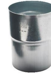
RHEINZINK verbindingsmof 80 mm