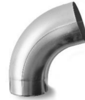
RHEINZINK bocht 80 mm 72 graden verjongd spie-eind